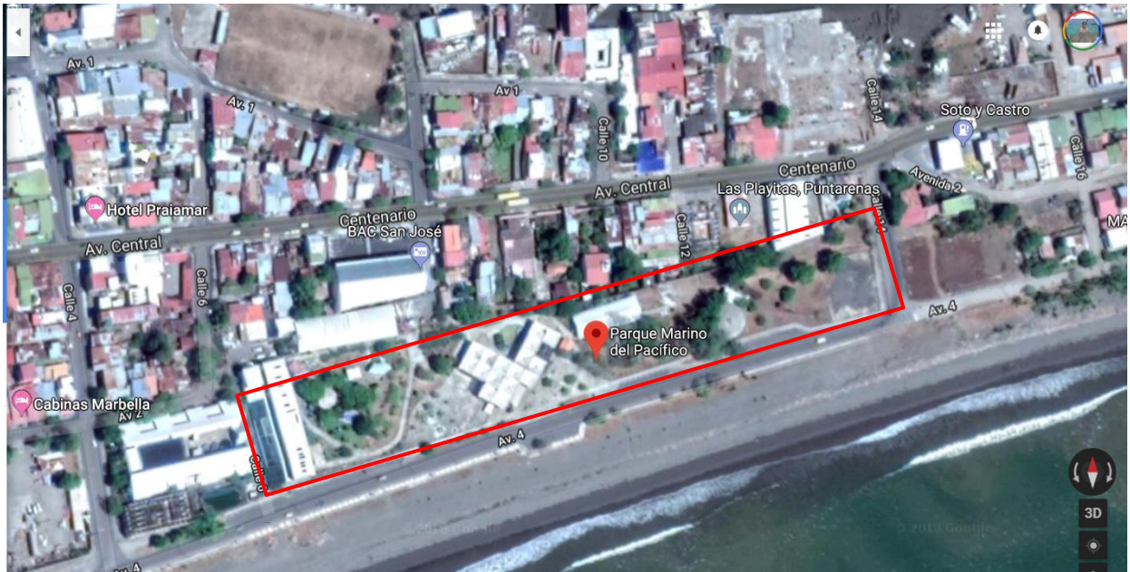
Ubicación del Parque Marino del Pacifico, Provincia Puntarenas, Cantón Central, Distrito Puntarenas

Se encuentra en una privilegiada zona de Puntarenas, frente al mar, tranquilo y accesible, lo que permite desarrollar diversidad de operaciones con especies marinas y asegurar la tranquilidad del visitante durante su tiempo de visita.